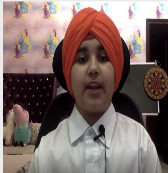
Amaira of P5 singing a Punjabi folk song in traditional attire

The Prime Minister of India unfurls the Indian flag at Red Fort. We all dress up in tri-color clothes and watch the Rajpath parade on television. We wait the whole year for the little brown packets of sweets! We all celebrate this day with great joy and enthusiasm.