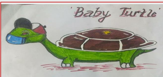
“The turtle takes care of herself in covid times” : As imagined by

I am a Turtle, live in water and land, My eyes are red, body is green, I eat jelly fish, live all over the world. I am baby turtle and I love my self, I move slowly and reached place, But sometimes I also win the race.